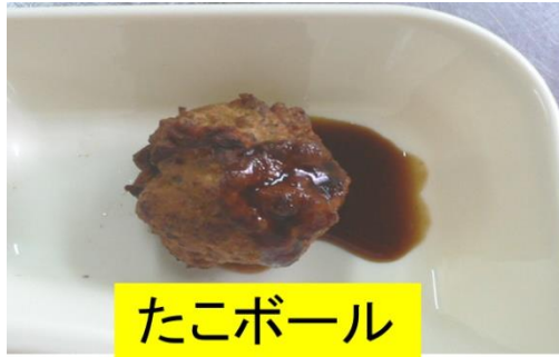
たこボール (たこやき)