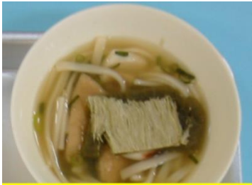
なにわうどん (きつねうどん)