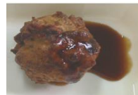
たこやき (たこボール)