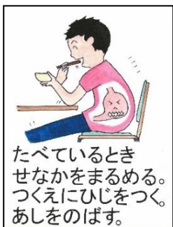
たべているときせなかをまるめる。つくえにひじをつく。あしをのばす。

○「右の食べ方をできるようにしましょう。こんな食べ方にすると食事が楽しく美味しく食べられますね」