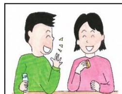
たのしく、はなしをしながら食べる。