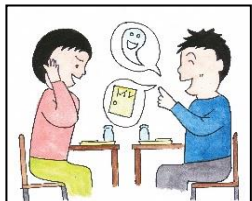
たべているとき、いやなはなしをする。

○「右の食べ方をできるようにしましょう。こんな食べ方にすると食べていて気持ちがいいですね」