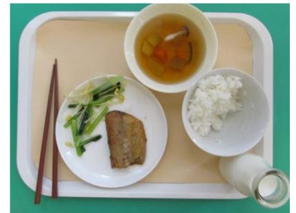
好きなように盛り付け

○「上(すきなように盛り付け)と下(食べやすい盛り付け)の写真は同じ給食の献立です。どちらの盛り付けがいいでしょうか。ワークシートに正しいと思う盛り付けの方に○をつけましょう」