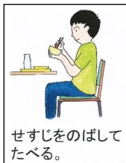
せすじをのばして食べる。