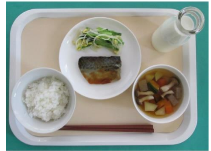
食べやすい盛り付け

(児童)「①さばがうらがえっている。②やさいがそとにでている。③はしがはみだしている。④しるの「ぐ」がすくない。⑤ごはんのいちがかたよっている。⑥ぎゅうにゆうがまえにでている」など