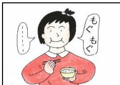
たべものがくちのなかにはいっているときは、はなしがない。