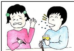
くちのなかにたべものをいれたままはなしをする。

○「これから食事の仕方の絵を見てもらいます。食事のマナーとしていいか、悪いか考えてみましょう。」