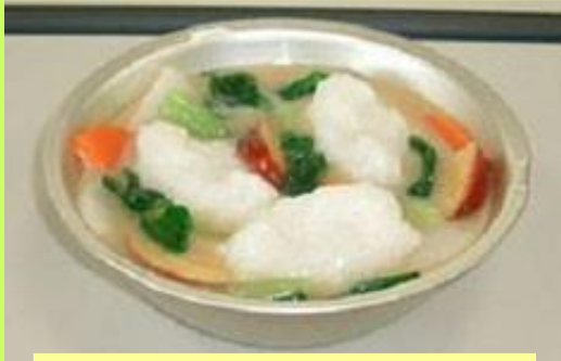
すいとんのみそしる

⑪ どんな物でもいいから、食べられることが給食の目的でした。給食があってもメニューは 1 つだけになってしまうこともありました。