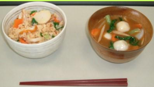
五色ごはん.栄養みそしる