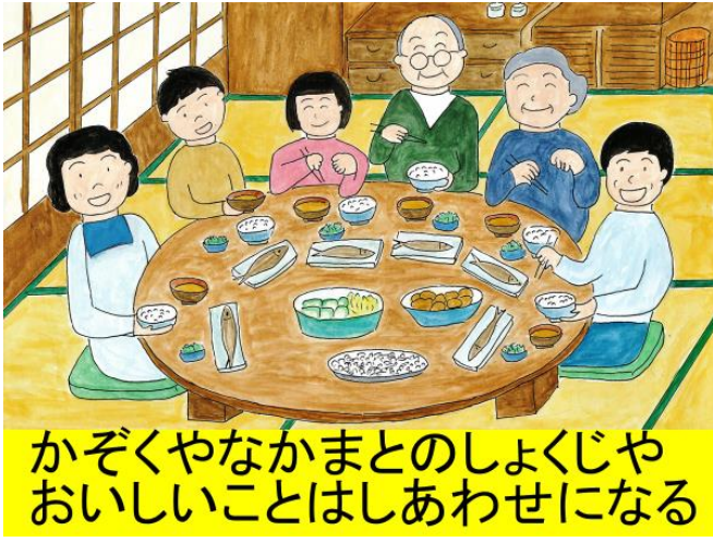
かぞくやなかまとのしよくじや おいしいことはしあわせになる

⑨「そして、夕方になると銭湯に行ってお腹がペコペコになって家に帰ると、みんなで畳み上に足の短いちゃぶ台の回りに座って、家族で夕食を食べたよ。それぞれの一日の出来事や学校の話 みんなでワイワイ話しながら食事をしたよ。みんなで楽しく食事を食べていると、なにを食べてもとても美味しかったな。」